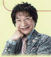
尾木 直樹 (教育評論家)