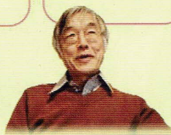
高橋 源一郎 (作家)