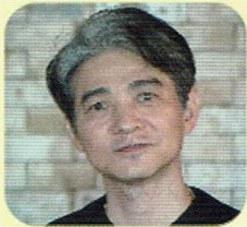
ナレーション 吉岡秀隆

2020年に文部科学省の学習指導要領が「探求学習」に大きく舵を切りました。30年も前から「探求学習」を実践する認可校が「きのくに子どもの村学園」です。子どもの村学園に長期取材したドキュメンタリー映画『夢みる小学校』に、中学生パートを追加撮影した『夢みる小学校・完結編』の登場です！文部科学省選定映画『夢みる小学校』が、さらにアップデートしました。