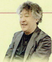
茂木 健一郎 (脳科学者)