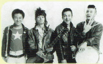
エンディングテーマ THE BLUE HEARTS『夢』

2020年に文部科学省の学習指導要領が「探求学習」に大きく舵を切りました。30年も前から「探求学習」を実践する認可校が「きのくに子どもの村学園」です。子どもの村学園に長期取材したドキュメンタリー映画『夢みる小学校』に、中学生パートを追加撮影した『夢みる小学校・完結編』の登場です！文部科学省選定映画『夢みる小学校』が、さらにアップデートしました。